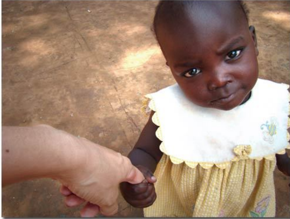
«Мама, тали...» (Мама, пошли)

И в этом я уверена. Любовь никогда не перестает.