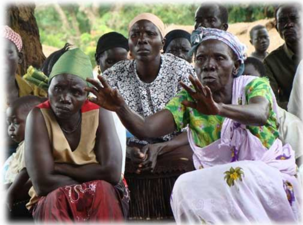
Деревенские женщины слушают послание надежды

Зачем я в шторме? Почему я в зоне войны? Я послана сюда, чтобы светить и приносить реальность другой реальности с собой. Я здесь, не потому что я осуждена жить в атмосфере тьмы и хаоса. Я здесь, потому что через любовь мне предназначено изменить это.