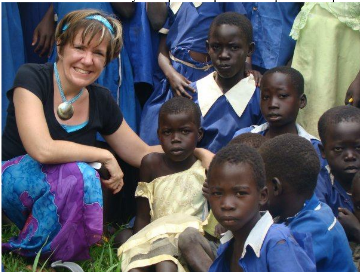
Любовь не знает границ

А как эта теория работает? Довольно хорошо, если спросите нас. Нас? О, вы думаете, что я отправилась в Судан одна? Простите меня, я забыла упомянуть, что на самом деле я была четвертая в команде: Отца, Сына и Святого Духа и я! Все они живут со мной, как я живу в них и мы делаем всё вместе. И потому эти три шага работают просто совершенно!