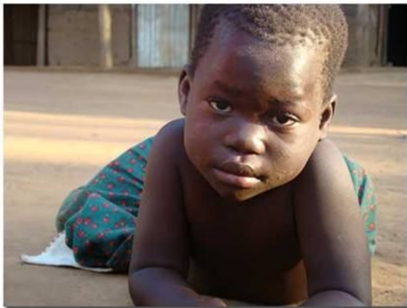
Один из моих великих учителей

Зная Его, я могу стать переживанием Его любви миру вокруг меня. Мне нечего взять с этого. Это призыв к состраданию, где я живу в Нем, и Он живёт во мне. Зная Его любовь. Я могу стать Его объятием для других. Находясь с Ним лицом к лицу, я тоже получаю исцеление своего зрения и учусь смотреть на всю жизнь Его глазами.