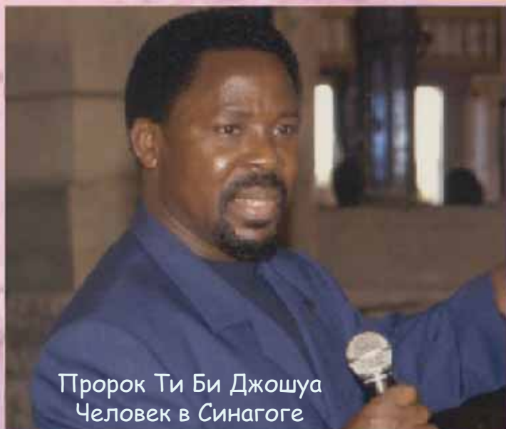
Пророк Ти Би Джошуа Человек в Синагоге